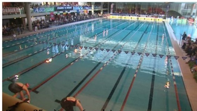
Bassin 25 mètres – 6 couloirs :