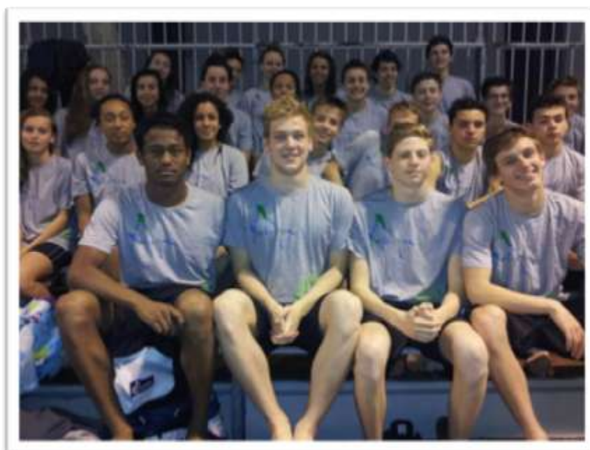
Sélection AQUITAINE C.F.R. Minimes et Cadets 2014 à Dunkerque